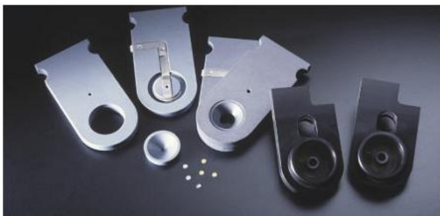
Держатель для образцов диаметром 3 мм, предназначенный для финального утонения, диаметром 10 мм – для предварительного утонения или электролитической перфорации, а также набор держателей форсунок. На рисунке также показан платиновый проводник и съемная диафрагма для образца.

При помощи данного интерфейса прибор TenuPol-5 может работать под управлением ПК. Результаты сканирования могут быть переданы в ПК для сравнения и сохранения в виде электронной таблицы. Это позволяет сравнить поведение различных материалов или отследить старение электролитов. Можно также сохранить различные экраны методов в виде растрового изображения.