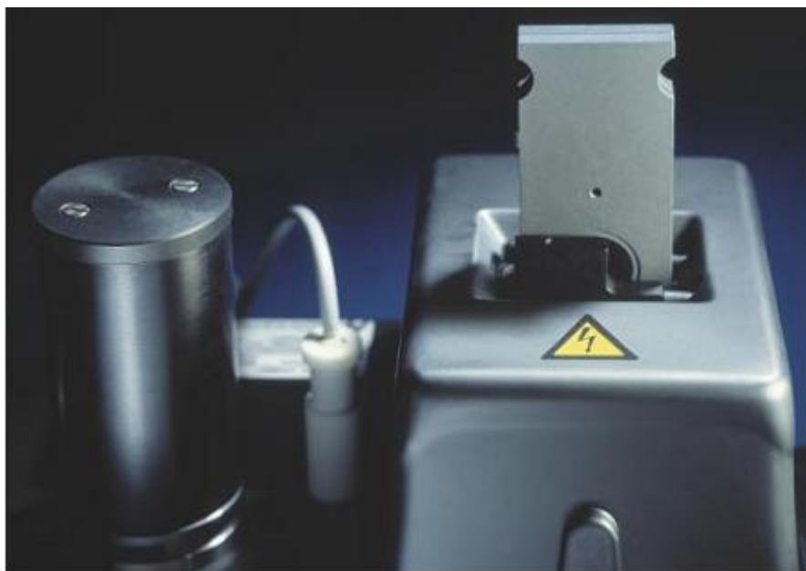
Блок полировки с насосом электролита, электронным термометром и заменяемыми держателями образцов.

Блок полировки/истончения выполнен в виде отдельного модуля, что дает возможность разместить его отдельно от блока управления. Если необходимо, блок полировки может быть установлен в вытяжном шкафу, а блок управления расположен снаружи. Прибор TenuPol-5 имеет два резервуара с электролитом, один из которых является изолированным и используется для работы со встроенным змеевиком охлаждения, а другой – неизолированным, предназначенным для охлаждения электролита, например, путем размещения резервуара в ванне со льдом.